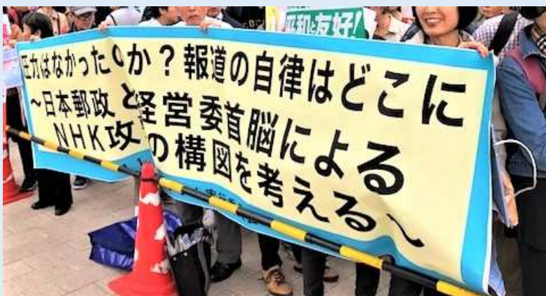
2019年11月05日に開催された「シンポジウム～日本郵政と経営委首脳によるNHK攻撃の構図を考える～」の横断幕

②森下俊三氏をNHK経営委員から罷免するよう、菅義偉内閣総理大臣に意見を提出すること。